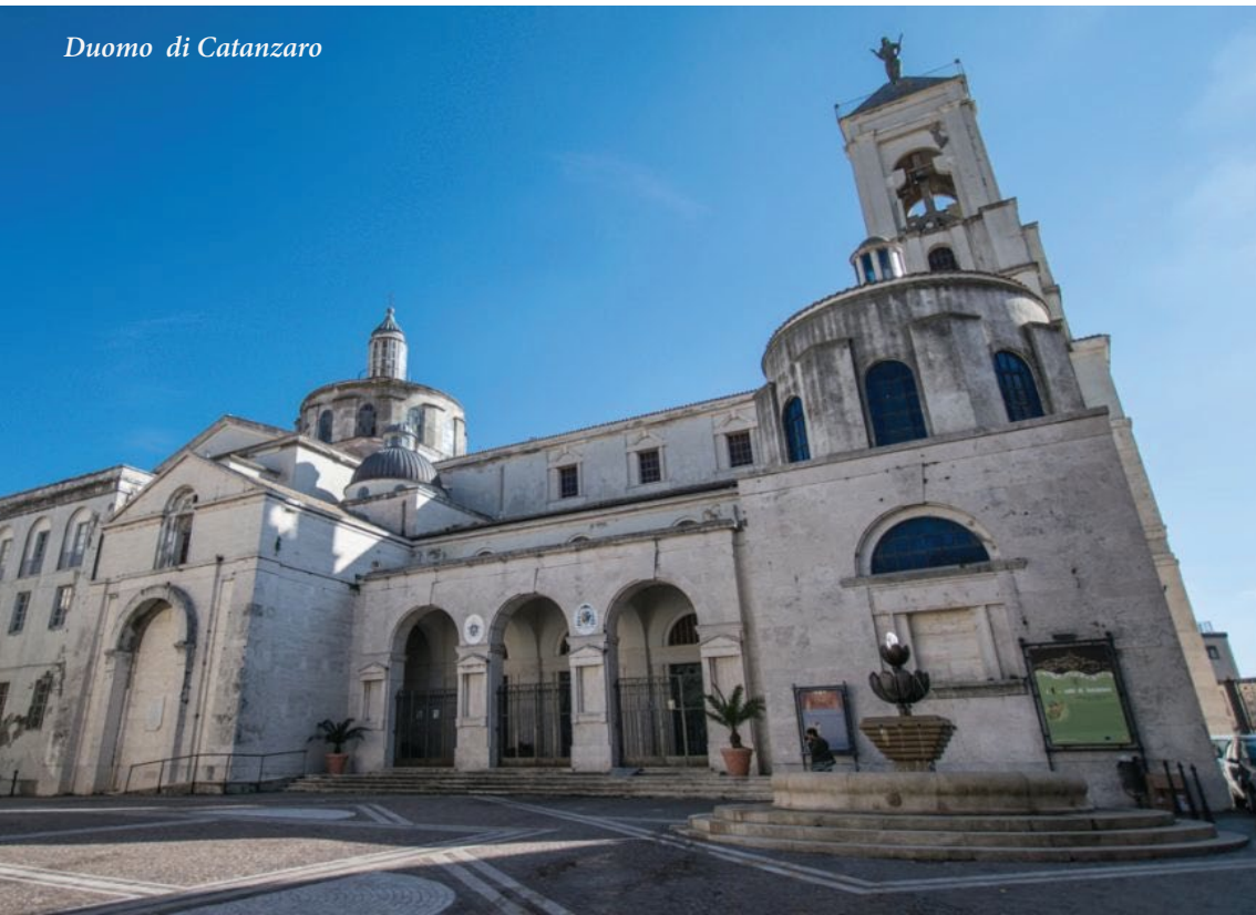
Duomo di Catanzaro