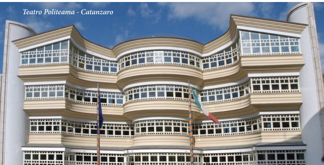
Teatro Politeama - Catanzaro